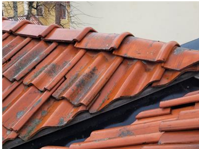
Synlig läkt i rännalar samt avsaknad av nocktätning