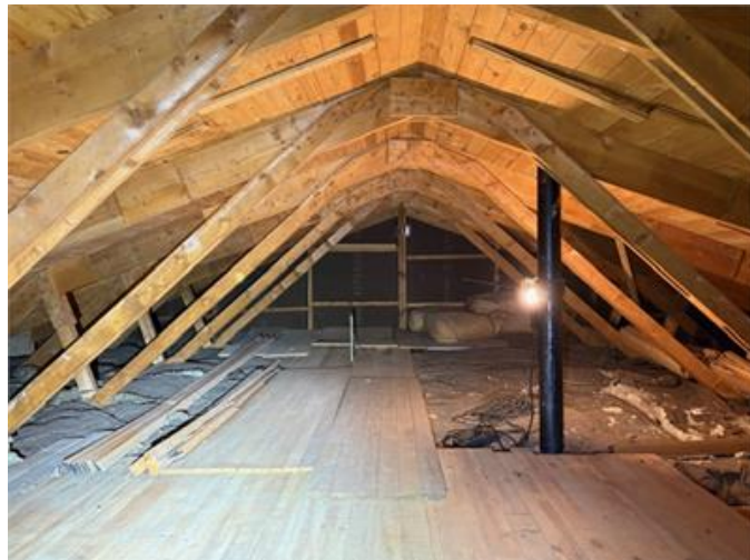
Bilden visar vy av vind.