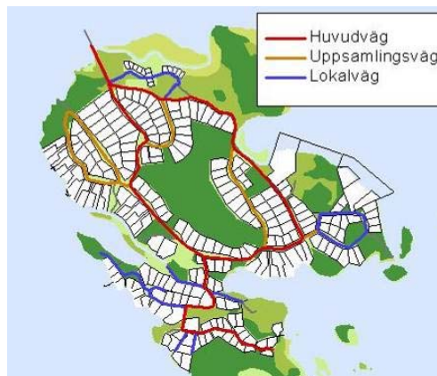
Förslag på översiktligt vägnät

Vägområdet är det område som är reserverat för vägarna inklusive diken och annan mark som behövs för vägen. I detaljplanen behålls de generösa vägområdena som redan finns i hög utsträckning. Därigenom finns det planmässiga förutsättningar att på sikt komplettera huvudvägnätet med gång- och