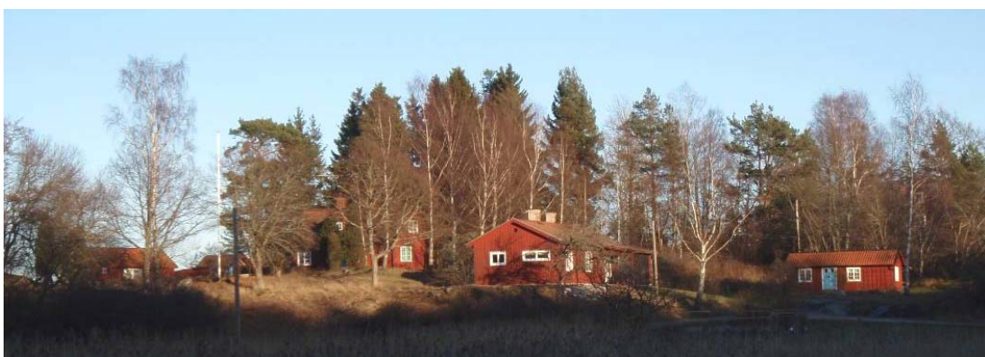
Bebyggelse inom fastigheten Öbolandet 39:1.

Bebyggelsen inom fastigheten Öbolandet 39:1 har tidigare tillhört Svartviks gård, som ursprungligen var ett skärgårdsjordbruk. Svartviks gård bedöms i programhandlingen som kulturhistoriskt intressant. Bostadshuset byggdes på 1930-talet.