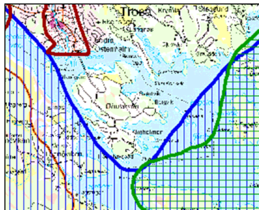
Karta över gräns för riksintresseområden för friluftsliv (blått) och natur (grönt)

Planområdet berörs inte av några riksintresseområden förutom för yrkesfisket. Alla grundområden inom djupområdet 0-6 m, med undantag för de områden som genom någon verksamhet är exploaterade och samtliga trålfiskevatten omfattas av riksintresset avseende yrkesfiske (3:e kap. MB). Vattenkvaliteten är viktig för att långsiktigt kunna bevara värdena och därmed kunna tillgodose riksintresset.