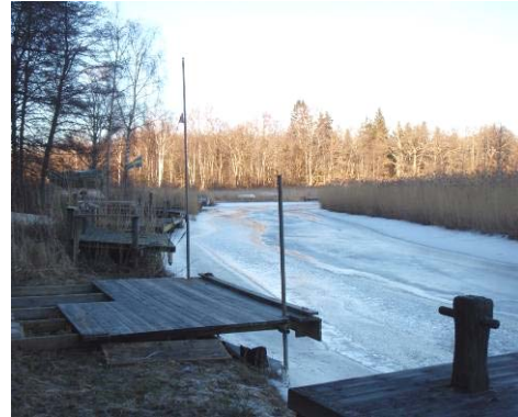
Kanal i nordost