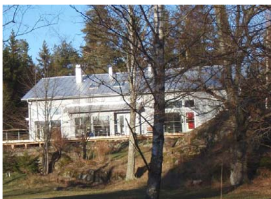
Nybyggt hus inom planområdet.