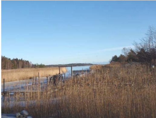
Utmed strandlinjen finns stora vassbälten