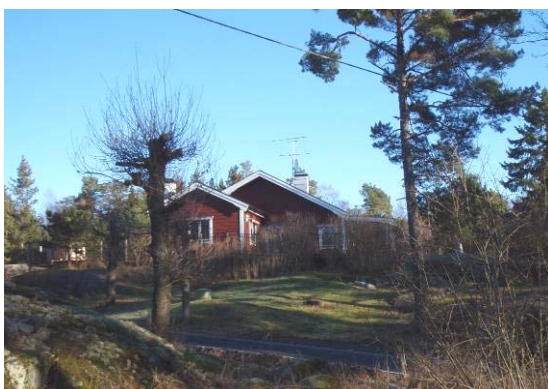
Många hus har röda träfasader och sadeltak.

Permanentningsgraden på Öbolandet är idag ca 40 %. Många har utökat sin boendetid från endast sommarmånaderna till att nu inbegripa en större del av året. I många fall nyttjas fastigheterna flera månader om året även om man formellt är skriven på annan ort. Den exakta permanentningsgraden är därför svår att bedöma men framöver beräknas den att öka ytterligare bland annat beroende på att många fastigheter står inför ett generationsskifte.