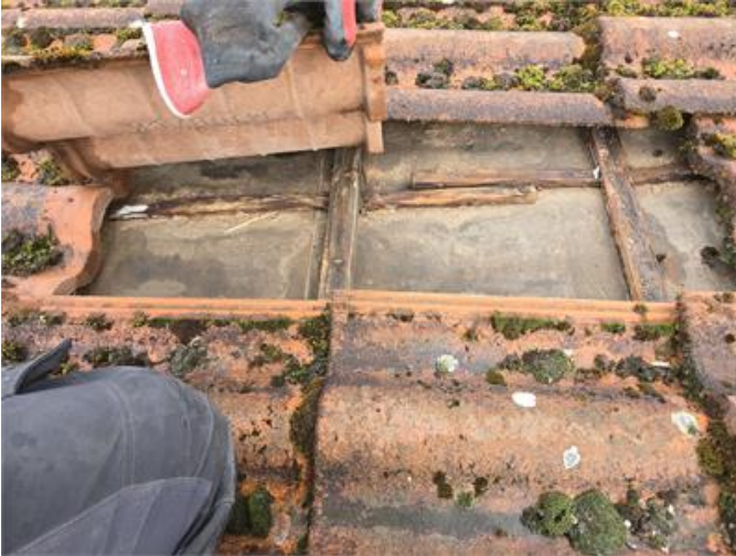
Bilden visar ett exempel på låglutande del/takkupan.