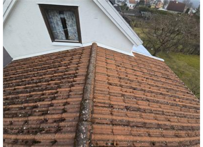
Överblick del av yttertak.