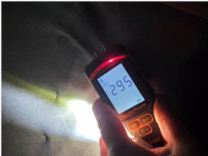
Bild från krypgrund under duschrum.