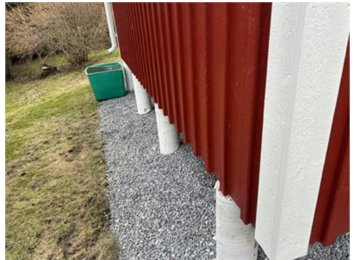
Fasad: Panelbrädor står emot plintar.