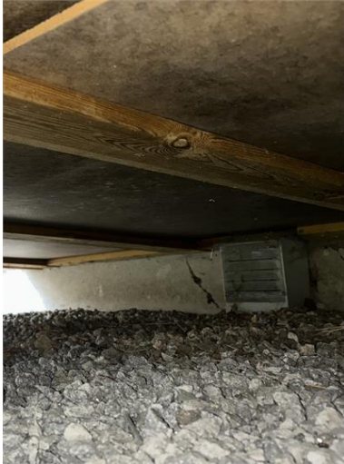
Plintgrund: Del av grunden.