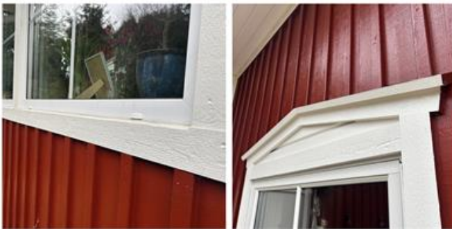
Fasad: Fönsterbrädor av trä