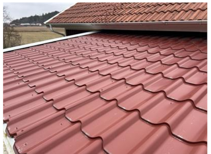
Tak: Översiktsbild ovan matplats.