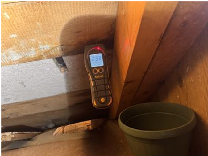
Takläckage vid ena sidovinden.