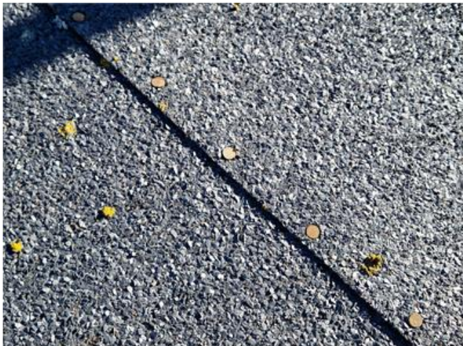
Carport: Synliga spikar noterades i taktäckning av papp