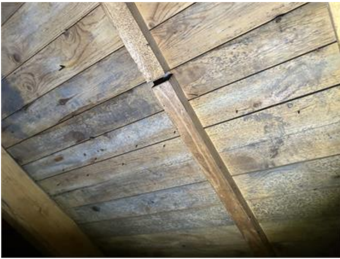
Nockvind: Mikrobiell påväxt förekommer på underlagstaket.