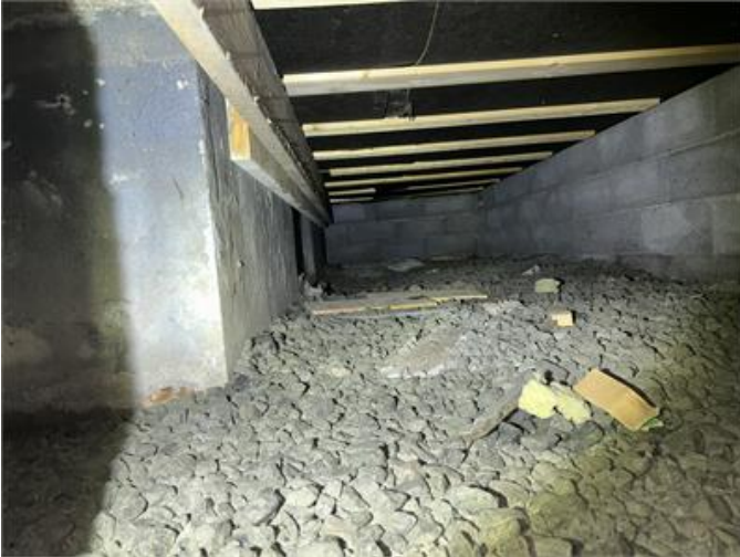
Krypgrund söder: Översiktsbild.