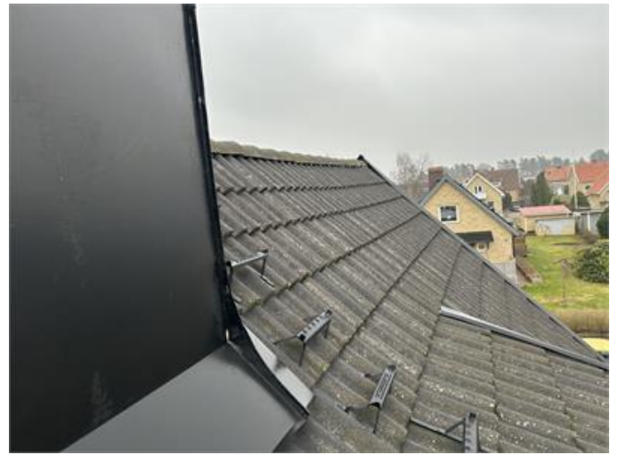
Tak: Översiktsbild 1.