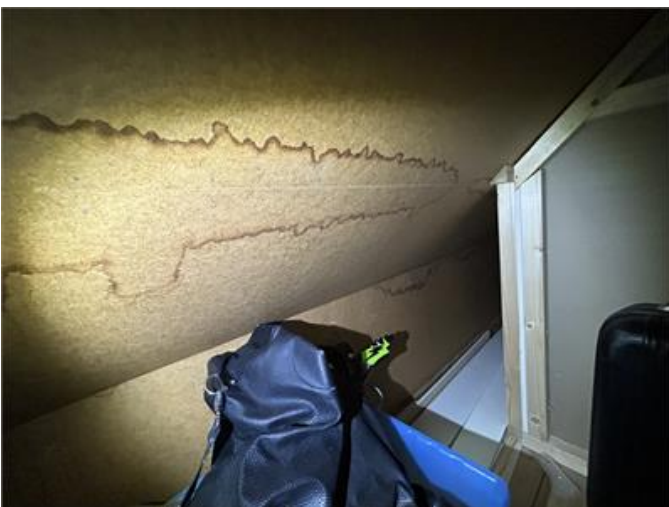
Sidovind: Fuktanvisningar noteras, torra vid besiktning.