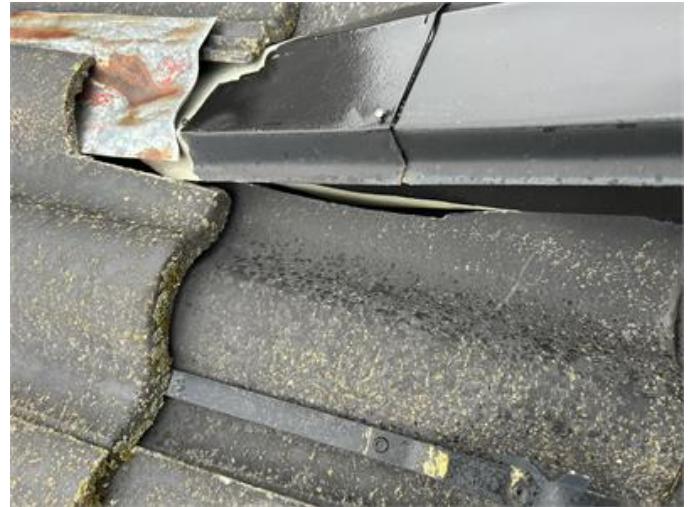
Tak: Otätheter förekommer i betongpannor, främst kapningar vid taklyft.