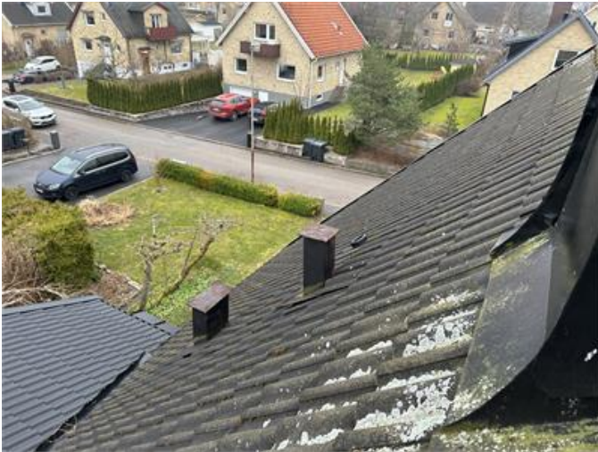
Tak: Översiktsbild 2.