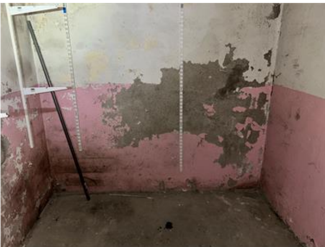
Källare: Färgsläpp förekommer på flera ställen.