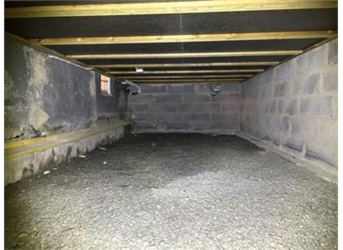
Krypgrund nordost: Översiktsbild.