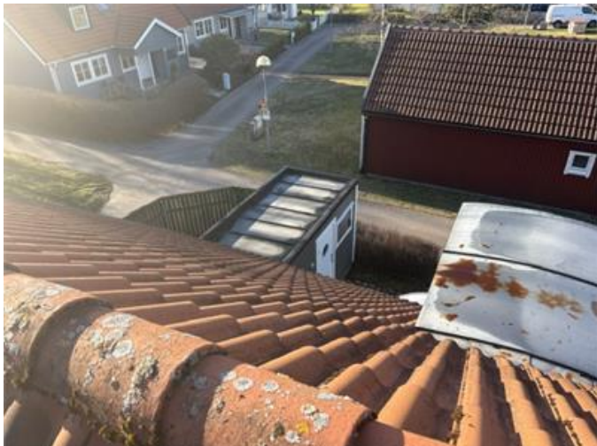
Bilden visar vy av tak.