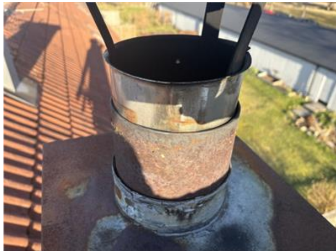
Bilden visar skorsten där otätheter/brister förekommer.