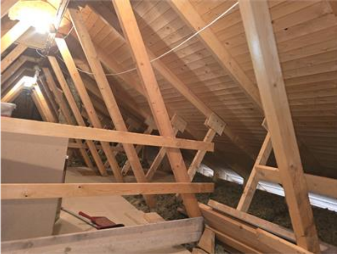
Överblick del av vinden.