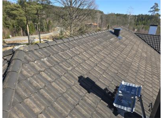
Överblick del av yttertak.