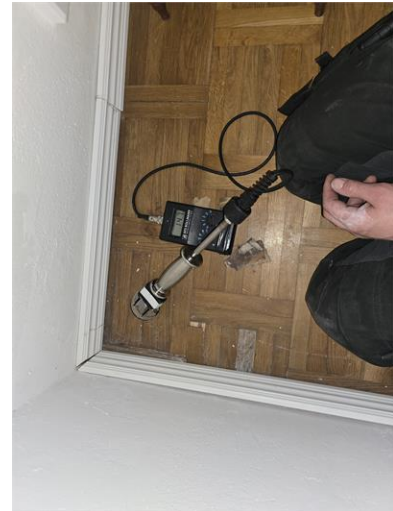
Mätning i äldre provhål.