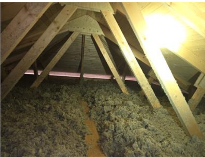
Överblick del av vinden.