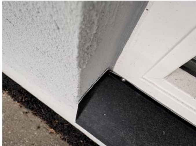
Bilden visar exempel på otätheter/brister vid/med plåtdetalj.