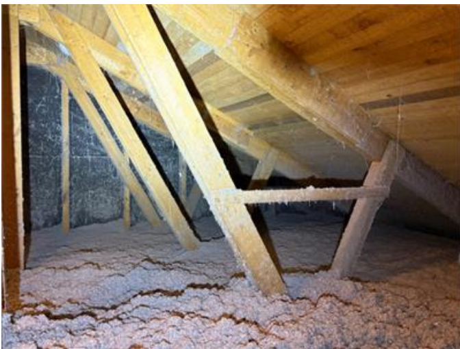
Bilden visar vy av vind.