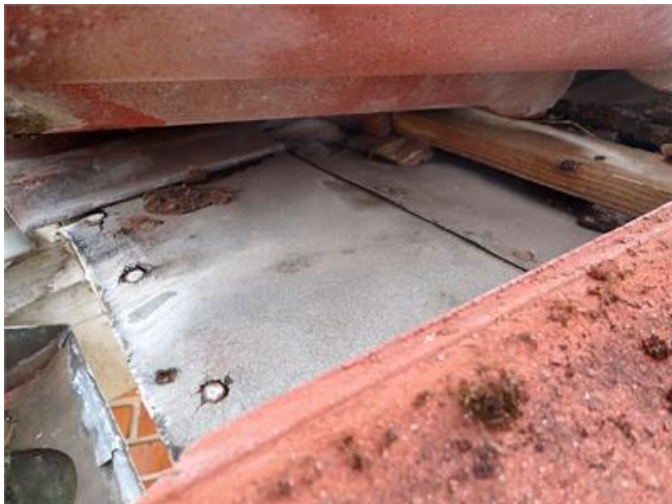
Spröd och torrsprucken takpapp.