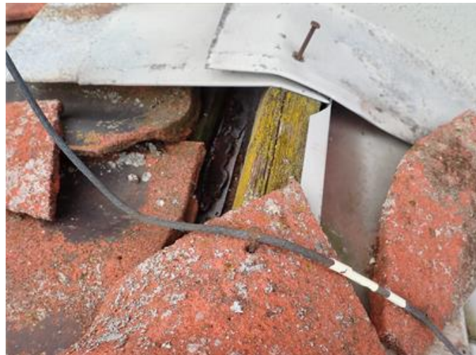
Trasiga takpannor och avsaknad av nocktätning.