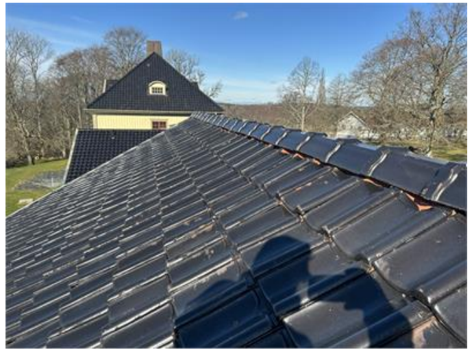
Tak: Översiktsbild 1.