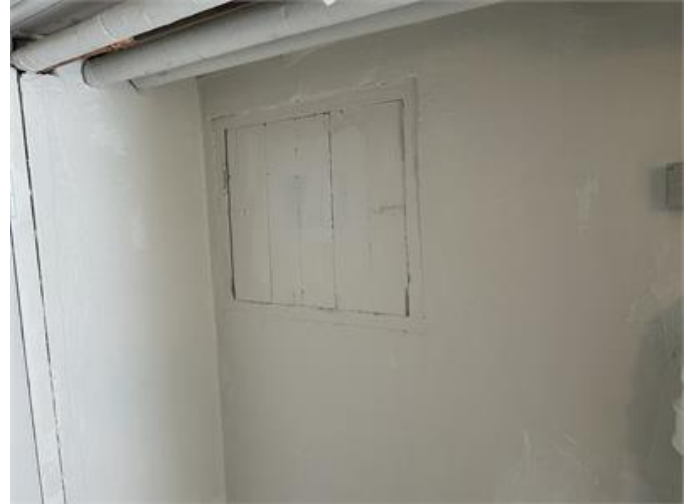
Krypgrund: Ej besiktigt p.g.a. att lucka ej öppningsbar. Rekommenderar en kompletterande besiktning efter att luckan öppnats.