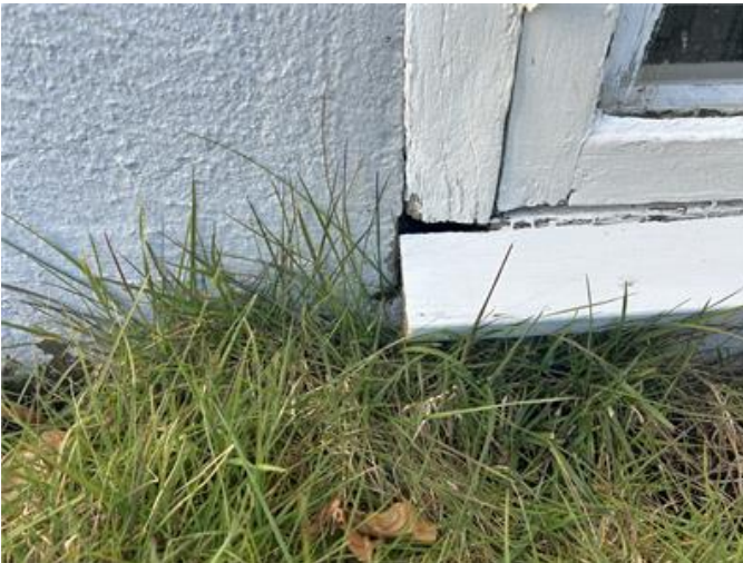
Sockel: Otätheter vid fönsterkarmar, kontakta murare för åtgärd.