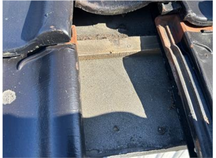
Tak: Underlagspappen är torr och otät.