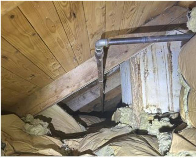
Nockvind: Översiktsbild 2.