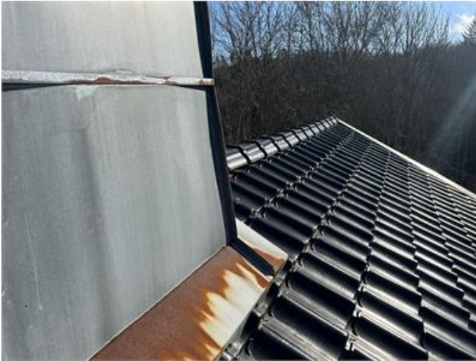
Tak: Översiktsbild 2.