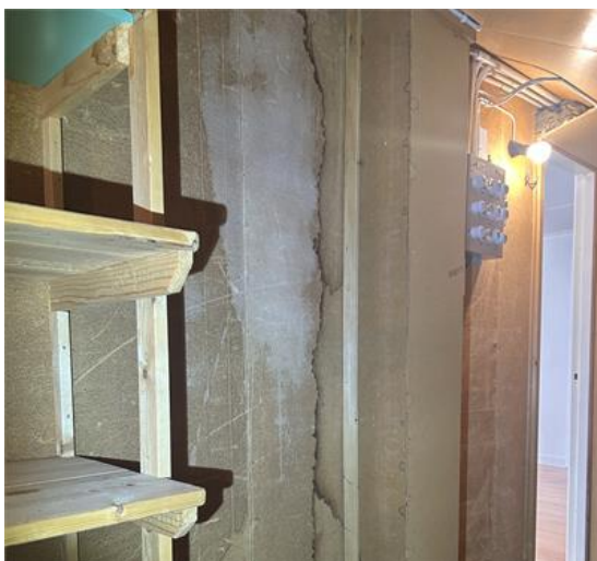
Sidovind: Fuktanvisning på spånskivor vid central, torra vid besiktning.