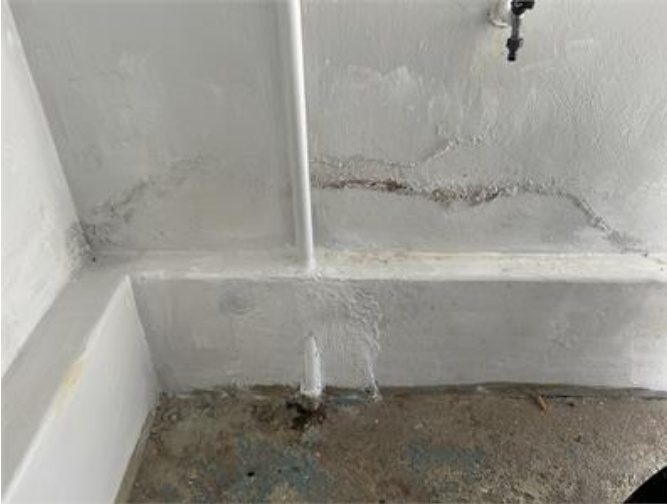
Källare: Färgsläpp och mineralutfällningar noteras i grundmuren.