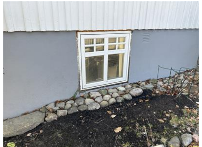
Sockel: Otätheter vid fönsterkarmar, kontakta murare för åtgärd.