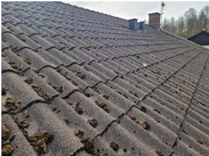
Vy på yttertak