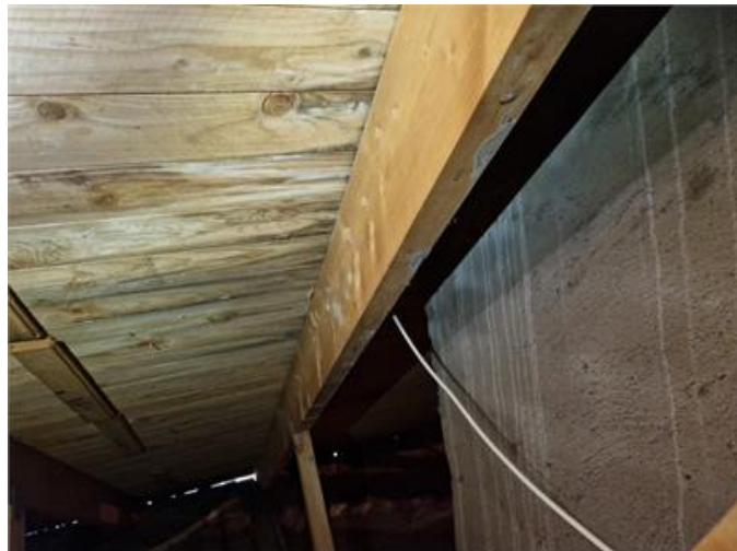
Vy på underlagstak med äldre spår av fukt/missfärgning